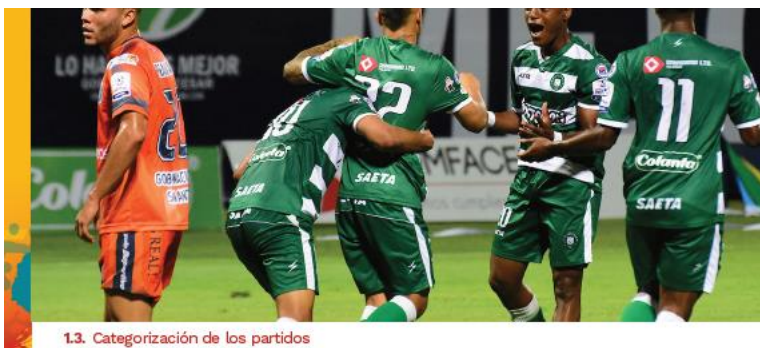
1.3. Categorización de los partidos

Recoge información cuantitativa y cualitativa del primer trimestre del año; tiempo en el que se adelantaron partidos de fútbol en los estadios.